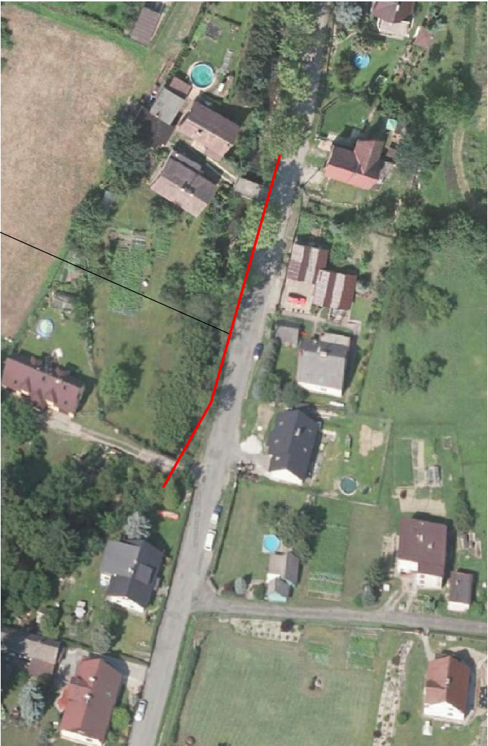
OPĚRNÁ ZEĎ PODÉL MK č. 218c